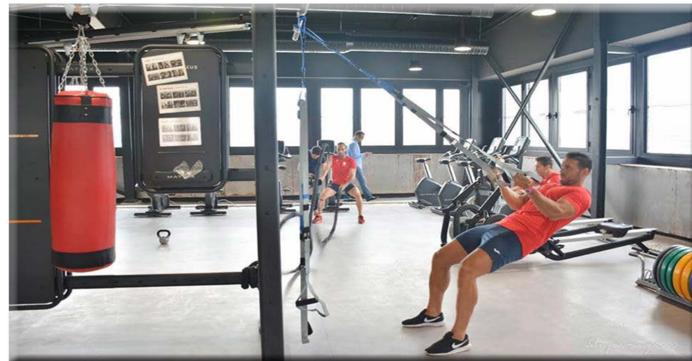
Programa Life (Método Fenómeno) en Santagadea Sport Puerto Cádiz

En lo que respecta al crecimiento, la compañía pondrá en marcha varios proyectos deportivos de distinta índole a nivel usos, pero siempre respetando los modelos de instalaciones que gestiona, con una clara tendencia hacia la promoción del bienestar y la calidad de vida.