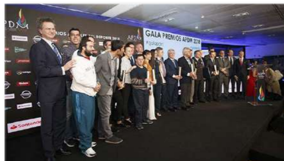
Gala de la APDM