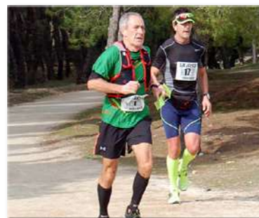
IX Raid Villa de Madrid