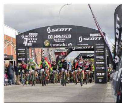
Circuito Scott 7 Estrellas