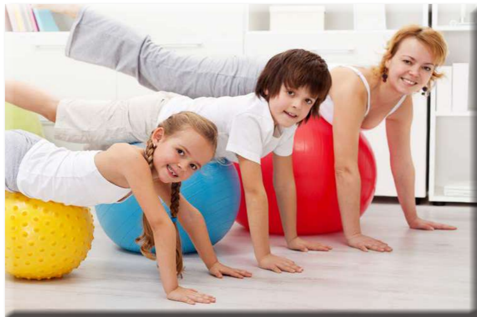
Santagadea Sport potencia la práctica deportiva en familia

Esta división de limpieza de centros deportivos es la especialidad con la que más se está creciendo los últimos años gracias al "Método Atysa". Este sistema se distingue, sobre todo, por la proximidad al cliente, los protocolos de actuación, el trabajo en equipo, la especialización y la confianza que día tras día depositamos en nuestros clientes. Destaca en este sentido la aplicación del programa