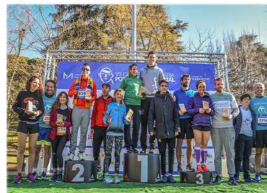
VII Carrera por la Salud Mental