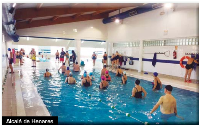
Alcalá de Henares

Las pruebas de Humanes de Madrid se llevaron a cabo los días 15 y 20 de noviembre en el Polideportivo Municipal Campohermoso. Participaron 40 personas que completaron una batería de seis tests físicos denominada "Senior Fitness Test". Se efectuaron los siguientes ejercicios: Sentarse y levantarse de una silla tantas veces como se pueda (30 segundos); flexión de brazos tantas veces como se pueda (30 segundos); caminar seis minutos; flexión de tronco sentado en una silla; juntar las manos tras la espalda; sentada en una silla, la persona debe levantarse, caminar hasta un cono y volver a sentarse.