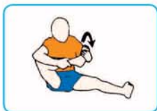
10 veces en cada dirección