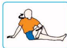
10 segundos cada lado