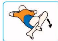
30 segundos a cada lado