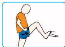
25 segundos cada pierna