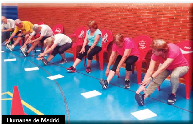
Humanes de Madrid

El programa de actividad física para mayores, Movinivel +, inició el pasado mes de noviembre su nueva temporada en los municipios de Humanes de Madrid y Alcalá de Henares. Los participantes realizaron los test correspondientes a la primera evaluación.