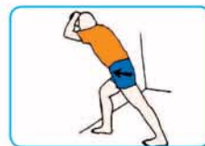
30 segundos cada pierna